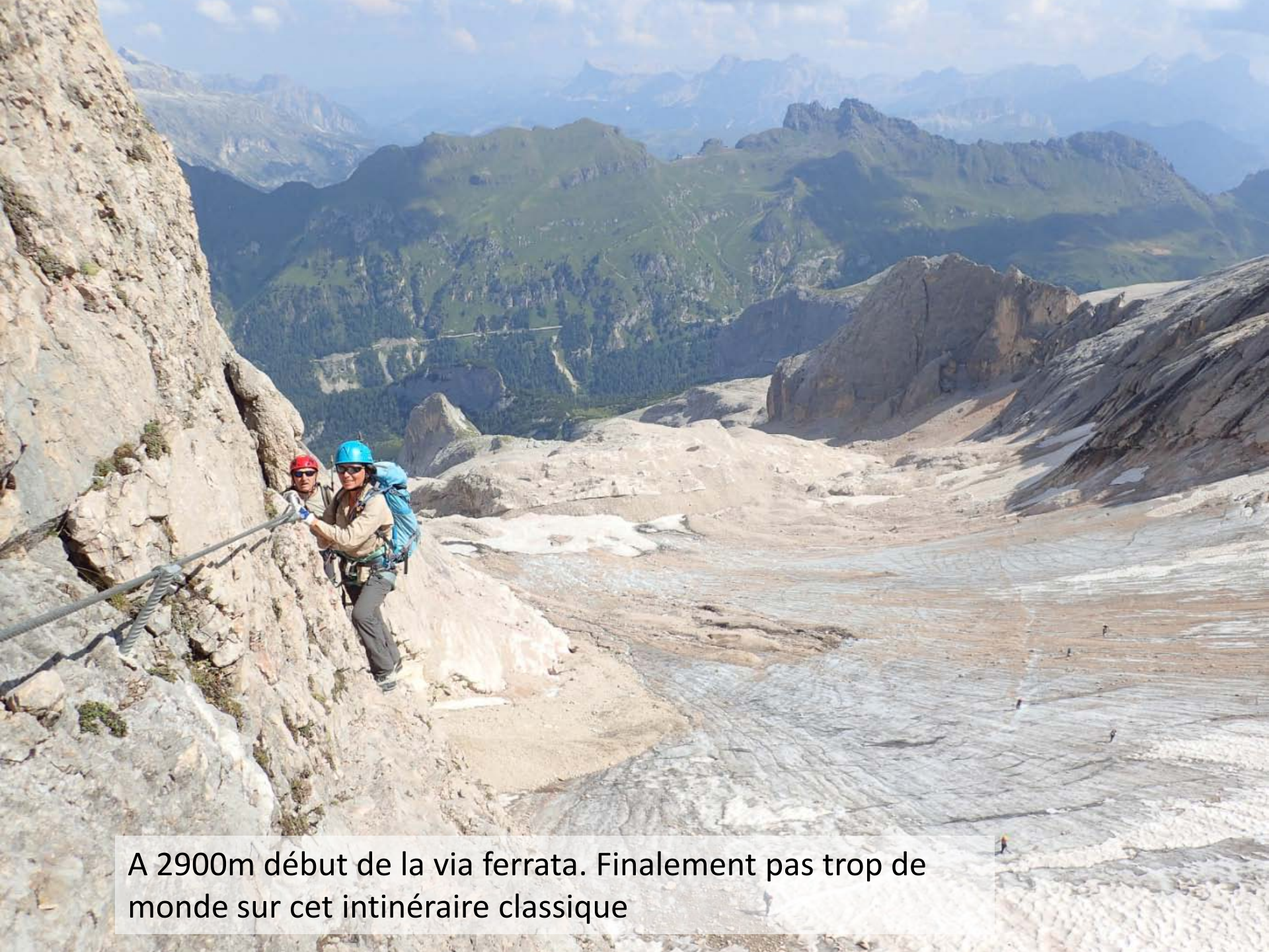
A 2900m début de la via ferrata. Finalement pas trop de monde sur cet itinéraire classique